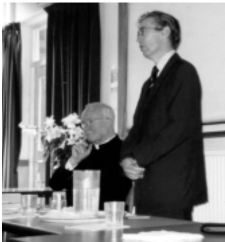
Le Cardinal Stafford (à gauche) à la conférence d'Oxford sur les communautés nouvelles et mouvements ecclésiaux en octobre 2001

Madonna House à prononcer une allocution dans le cadre d'une conférence tenue à Oxford sur le thème des communautés nouvelles et mouvements ecclésiaux, dont fait partie intégrante Madonna House. Précisons que nous formons davantage une communauté