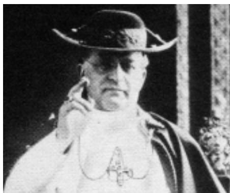
Le pape Pie XI, auteur de Quadragesimo Anno (instructions sur l'ordre social) publié en 1931