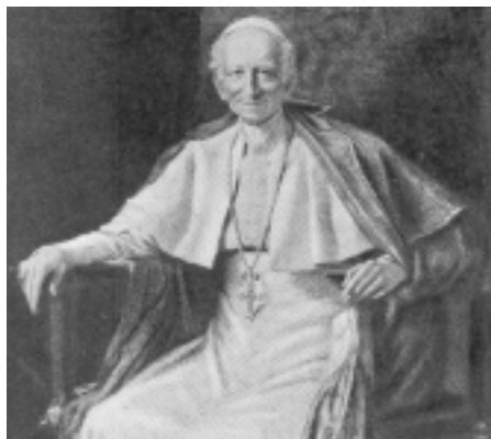
Le pape Léo XIII, auteur de Rerum Novarum (sur les conditions de travail des classes ouvrières) publié en 1891

House, avec l'approbation de l'évêque, Madonna House constituait désormais une « petite Église entière » ou, devrais-je dire, une « petite Église complète », soit un évêque, des prêtres et le peuple de Dieu. »